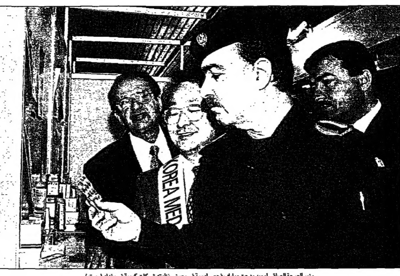
وزير الصحة العراقي أميد ممدحت مبارك يخلص أدوية في معرض نقلته شركات كبرى في بغداد

صدام حسين قد يقرر استئناف تنظيم رحلات الحج للقادرين من العراقيين إلى مكة المكرمة، وهو قرار يأتي بعد اعتقال عدد من العراقيين في لندن والمغرب والكويت لحساب مخابرات بغداد.